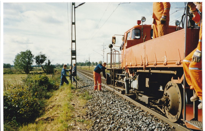
Utdragning av kabeln med hjälp av motorvagn