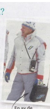
En av de första mobiltelefonerna.

Mobiltelefonen är kopplad till person, förr i tiden var fasta telefonen kopplad till en plats. Det var ingen som ringde upp och frågade: "Var är du?" Det var ju självklart att den som svarade befann sig där telefonen var installerad. Många minns barndomens telefon på ett litet bord i hallen. Gärna placerad på en liten broderad duk.