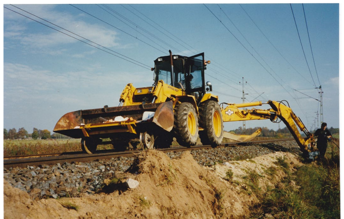
Nedplöjning av kabeln med traktorgrävare