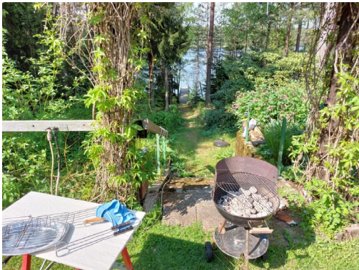
Fint läge med grillplats och egen brygga