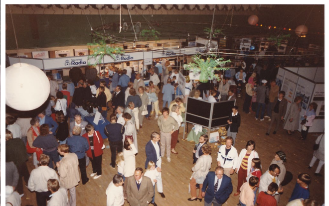
Bild från Parkhallen där bl a Televerket Radio hade en monter.