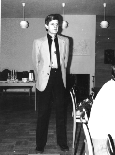
En ung välklädd kändis