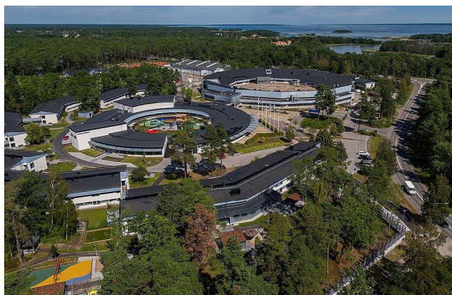
Efter renovering och ombyggnad 2021.

I dag har kommunen tagit över lokalerna och byggt om den till flera olika verksamheter i gamla Kalmar nyckel med inriktning på utbildning även om åldersgrupperna är lite yngre än på teliatiden.