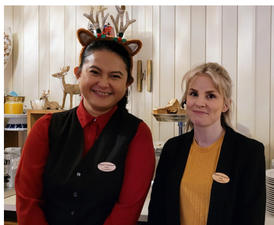
Delar av personalen