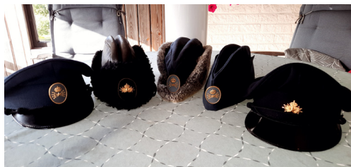
Mössorna är från vänster 1,3 och 4 från 60-talet och 2 och 5 från 50-talet.