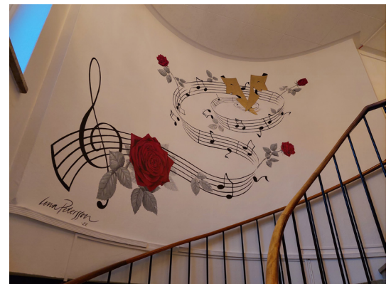
Detalj från den nyrenoverade Stadsteatern