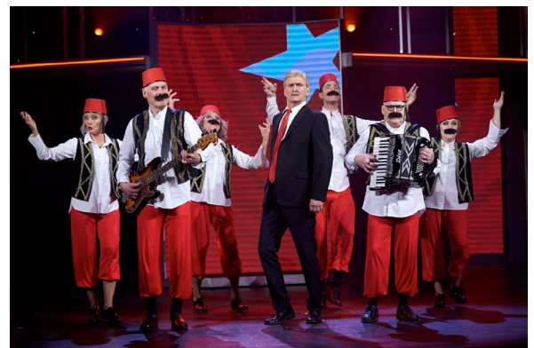
En riktig fezsång