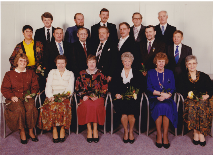
"Klockutdelning" 1990.