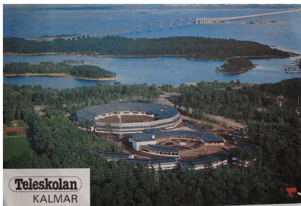
När det begav sig 1978

År 2000 såldes skolan och dess utbildningar av det sedan 1993 bolagiserade Telia till Svenska Teknologföreningens utbildningsföretag, STF. De drev den vidare till 2003 då den försattes i konkurs.