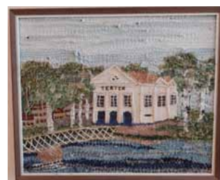
Borås gamla teater