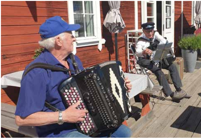
Plötsligt kom ännu en dragspelare gående!