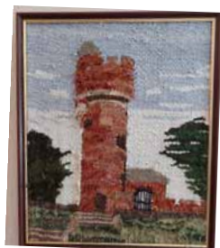
Vattentornet i Borås