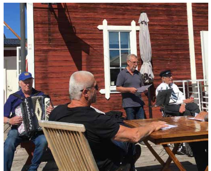
Kontaktmannen framträder som sångare