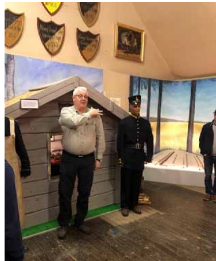
Vill inte berätta vem men en av oss trodde inte på hans historier, det gör man inte ostraffat se här nedan.