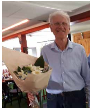
Sten fick en blomma som tack