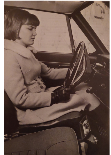
Mobiltelefonen med vars hjälp man kan ringa från och till bilen