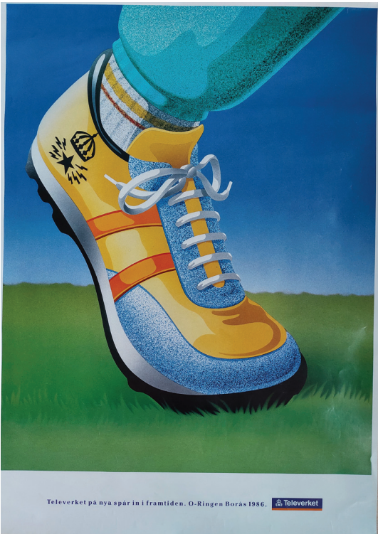
Televerket på nya spår in i framtiden. O-Ringen Borås 1986.