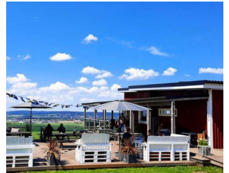
Cafereria och Restaurang på Älleberg