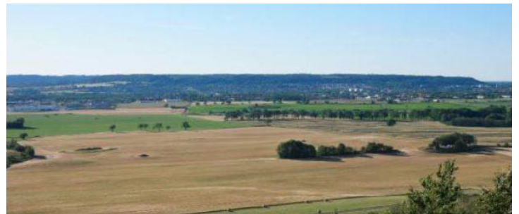
Utsikt från Älleberg