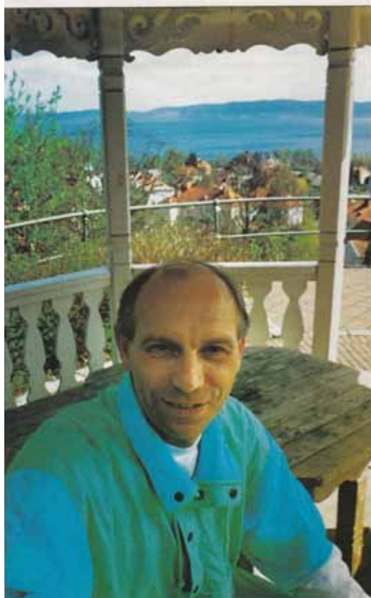
Att lära känna Jönköping är också en skönhetsupplevelse.