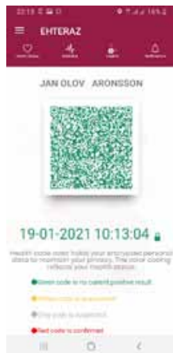
App som visar status