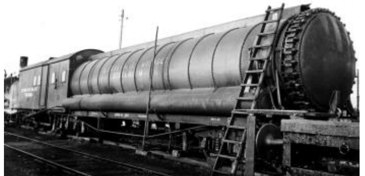
Tab för impregnering av stolpar lämnar Töreboda 1939. 15 000 stolpar hade impregnerats.