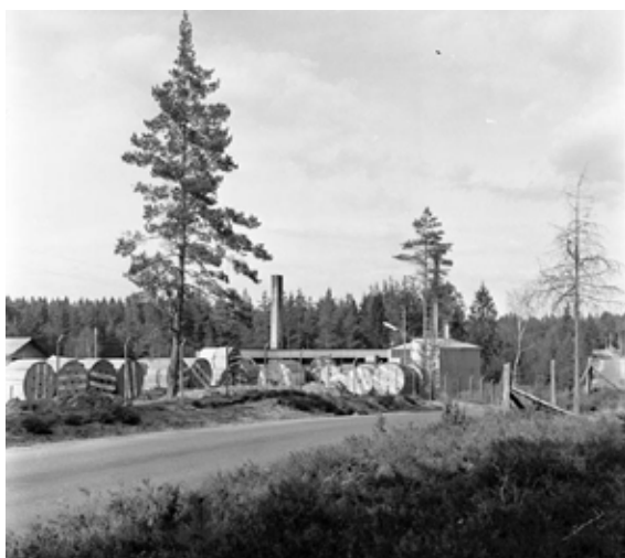
Blysmältningsanläggningen i bakgrunden

På platsen som användes för bygget av förrådet hade många människor mist sitt liv. Här hade nämligen den sk Galgbacken för norra Skaraborg legat. Vid grävningar hittades 18 avrättade människor, eftersom man vid denna tid inte fick begravas i vigd jord. Dessa kroppar flyttades då till Fredsbergs kyrkogård. Den sista avrättningen skedde år 1862 då ett äkta par från Delebäck i Hova socken halshöggs. De hade giftmördat mannens föräldrar. Fram till år 1752 användes hängning som avrättningsmetod.