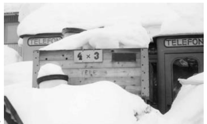
Slätteförådet 1960. Då fanns det snö!