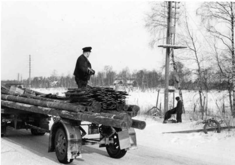
Utkörning av linjemateriel. På flaket Evert Gustafsson kallad Pantern