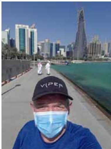
Det blev långpromenad efter 7 dagar i karantän