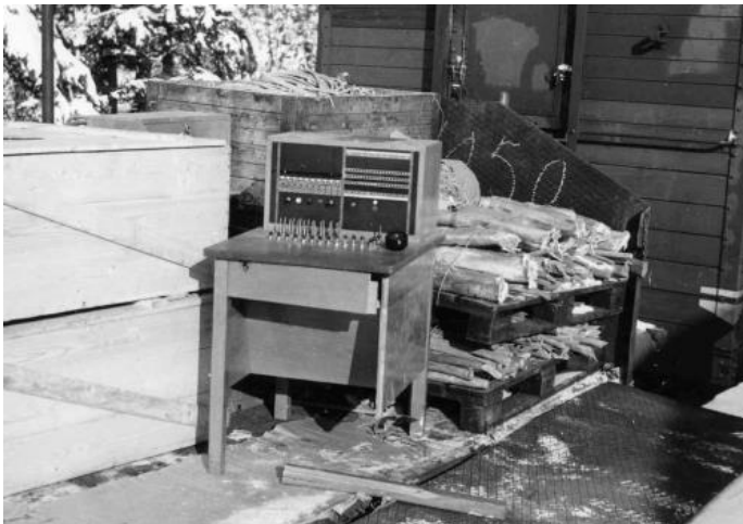
Skrot bland annat avhuggna kabelbitar och en snöväxel