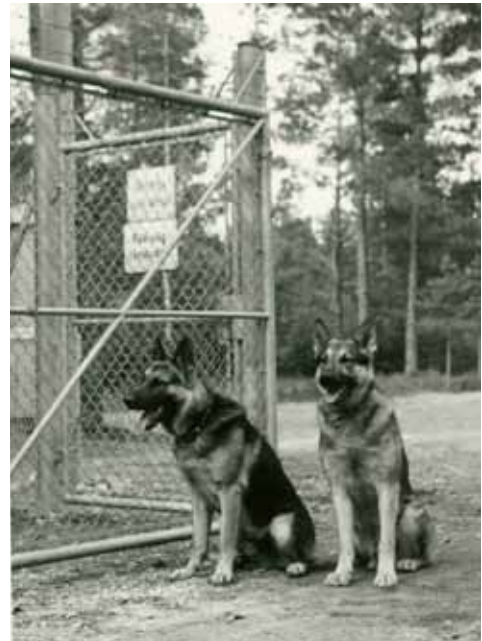
De fruktade vakthundarna