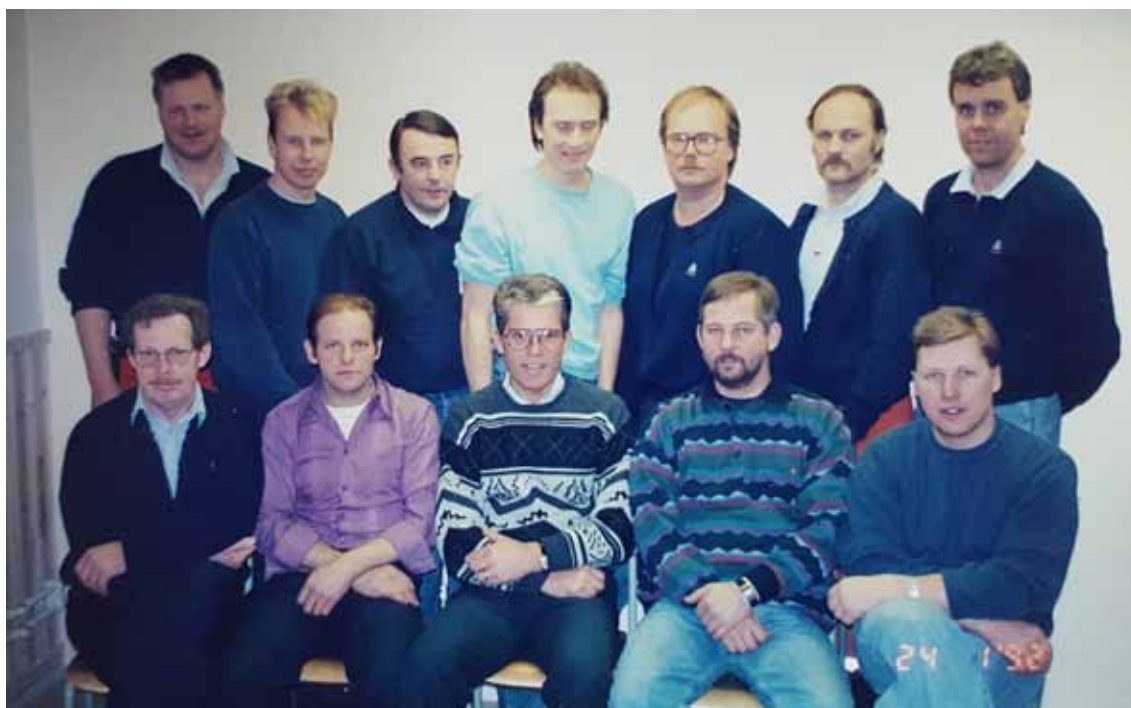
Nätanläggning Skara-Skövde 1991.