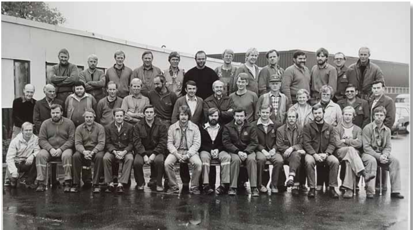
Personal placerade i Skara på 80 talet.