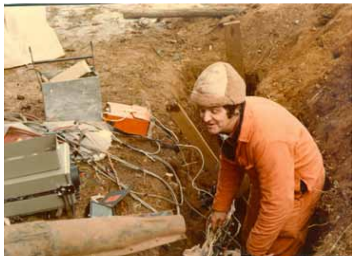
Tore har trasslat in sig