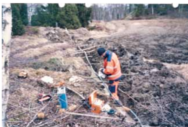
CHE 100:0,7. Avbrott en tråd. Sk 1 Ksö. Staffan.