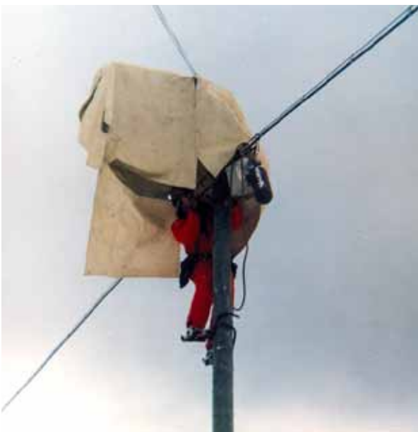
Tore Utter sätter upp kabelbryggan