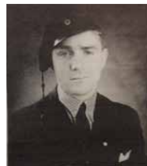
Hjalmar som Chalmerist, Bild: E Mårild/B Hallberg.

Mårild anställdes vid Televerket i Göteborg 1937 vid ingenjörskontoret stadssektionen där han 1946 blev linjeingenjör. 1950 flyttade han över till distriktsbyrån och blev där 1958 förstes driftsingenjör. 1964 blev han förste sektionsingenjör vid ingenjörskontoret i Göteborg och 1965 blev han anläggningschef i den nyinrättade telecentralen i Göteborg. Den 1 april blev han utsedd som teledirektör i Borås.