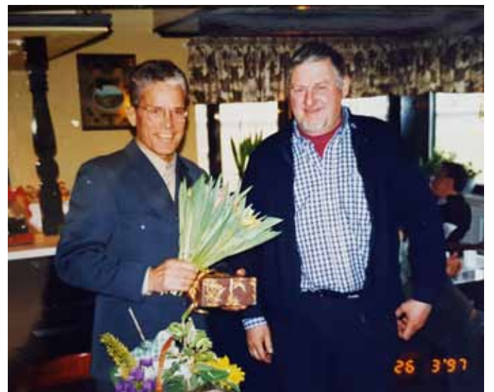
Avtackning pension 1997.