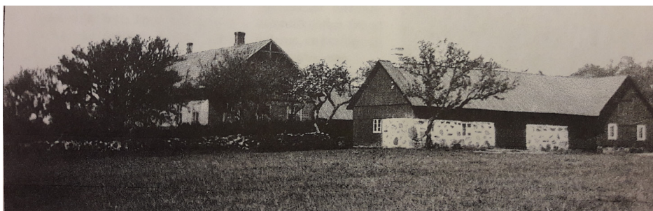
Gården Måralt år 1935, fyra år efter att gården gick ur släkten Mårilds ägo efter generationer av ägande och brukande.

Gården Måralt och bygden omkring har en historia från Snapphandetiden och olika händelser från den tiden.