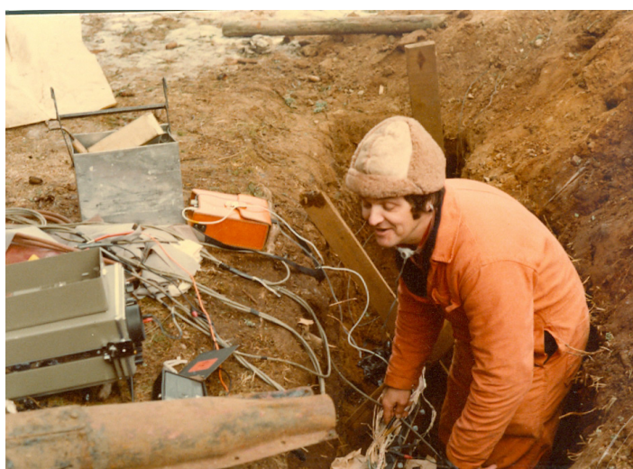
Tore har trasslat in sig