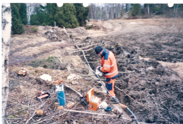
CHE 100:0,7. Avbrott en tråd. Sk 1 Ksö. Staffan.