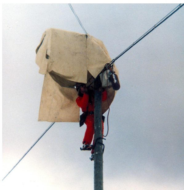
Tore Utter sätter upp kabelbryggan