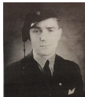
Hjalmar som Chalmerist, Bild: E Mårild/B Hallberg.

Mårild anställdes vid Televerket i Göteborg 1937 vid ingenjörskontoret stadssektionen där han 1946 blev linjeingenjör. 1950 flyttade han över till distriktsbyrån och blev där 1958 förstes driftsingenjör. 1964 blev han förste sektionsingenjör vid ingenjörskontoret i Göteborg och 1965 blev han anläggningschef i den nyinrättade telecentralen i Göteborg. Den 1 april blev han utsedd som teledirektör i Borås.