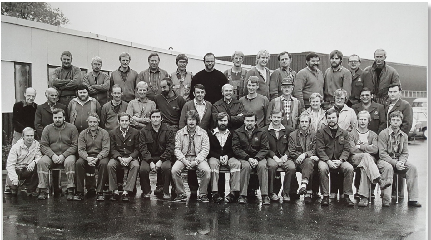
Personal placerade i Skara på 80 talet.