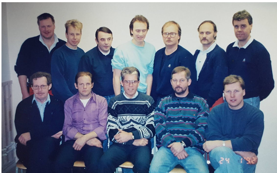
Nätanläggning Skara-Skövde 1991.