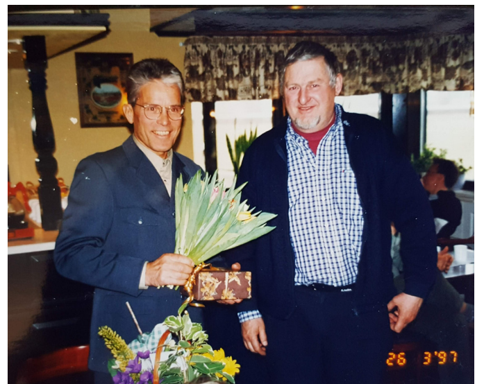
Avtackning pension 1997.