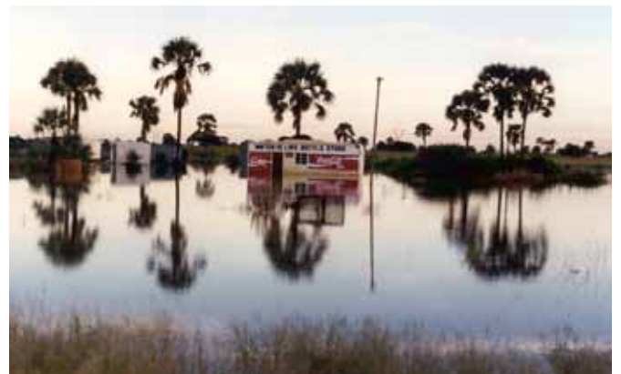
Water is life bottle store