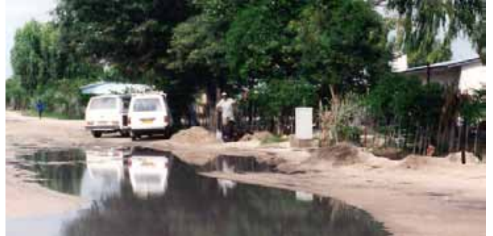
Kabelfel vid Spar