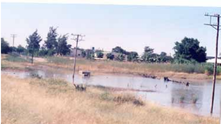
Luftledning i Oshakati