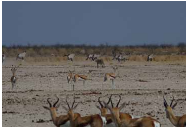
Lejon vid vattenhål i Etosha