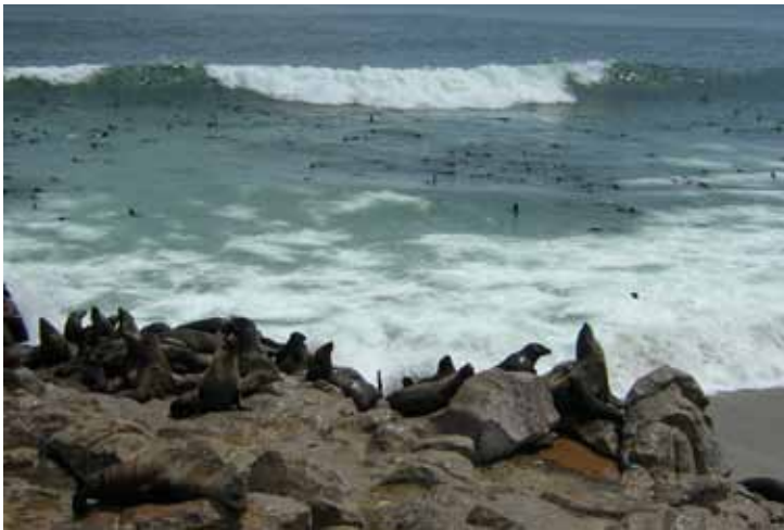
Cape cross sälkoloni