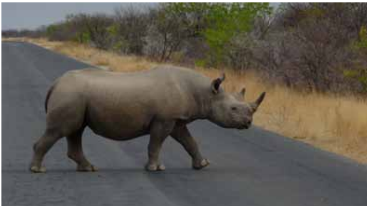
Noshörning i Etosha