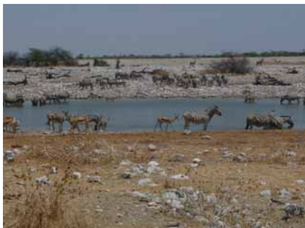
Vattenhål vid Okaukuejo Etosha