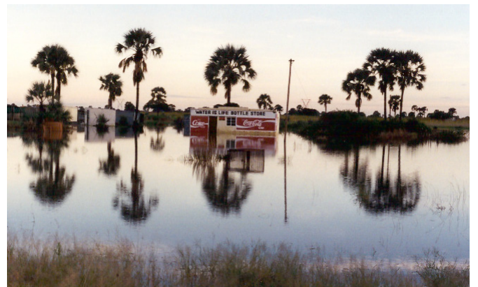
Water is life bottle store