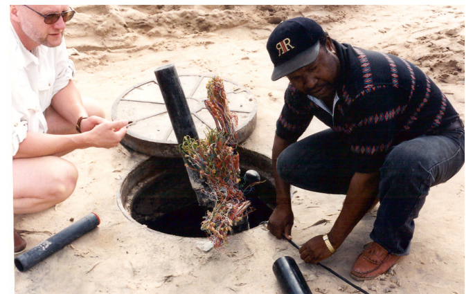
Sören och kabelreparatör Andersson vid ett manhole