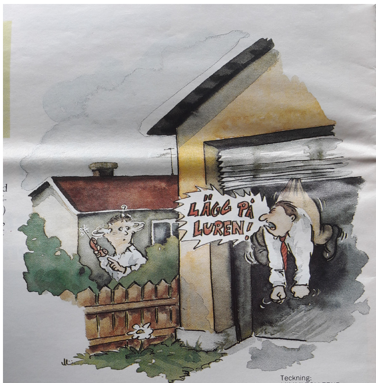
Teckning: MIMMI TOLLERUP