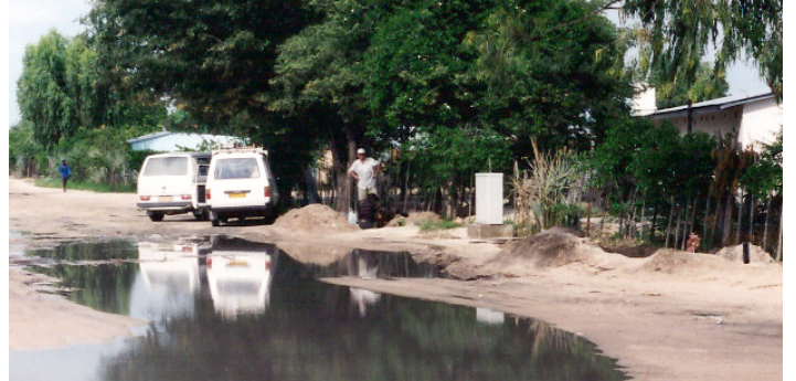
Kabelfel vid Spar