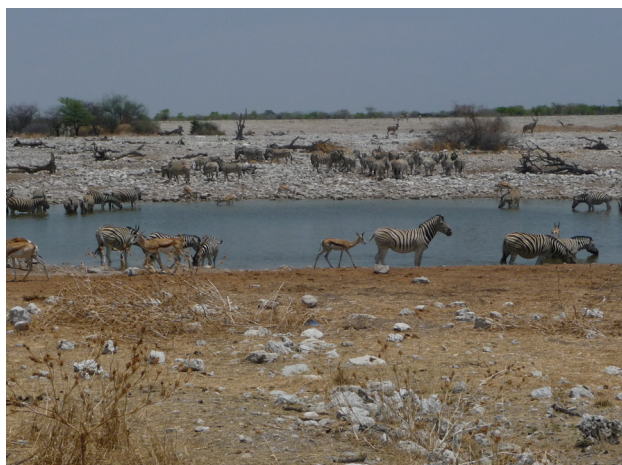
Vattenhål vid Okaukuejo Etosha