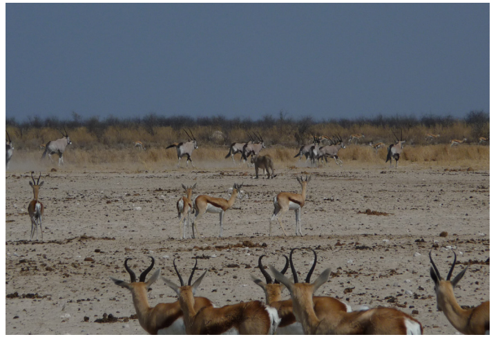
Lejon vid vattenhål i Etosha