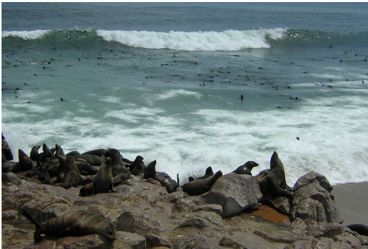
Cape cross sälkoloni