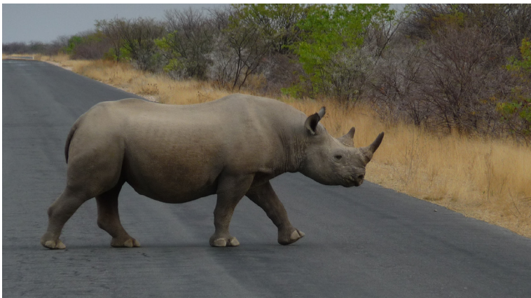
Noshörning i Etosha