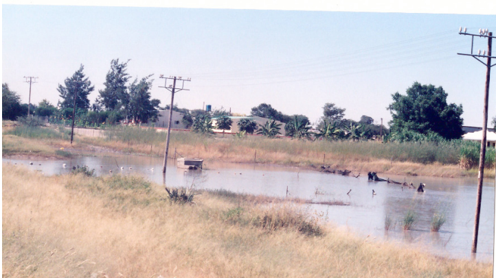
Luftledning i Oshakati