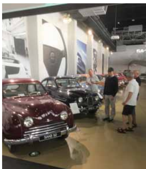
Äldre modeller av SAAB