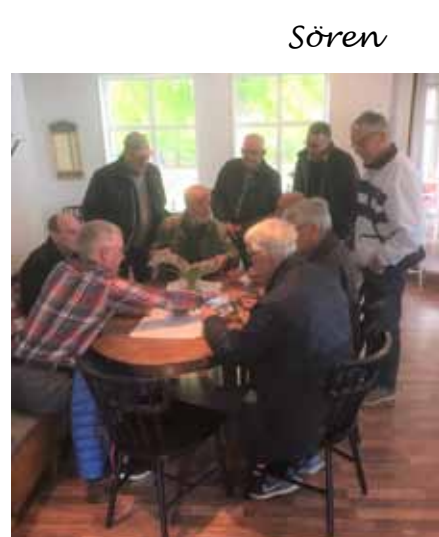
Studerar gamla foton.