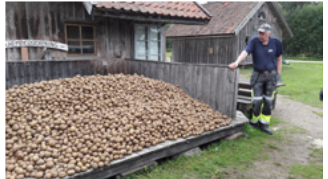
Potatis som ska bli potatismjöl