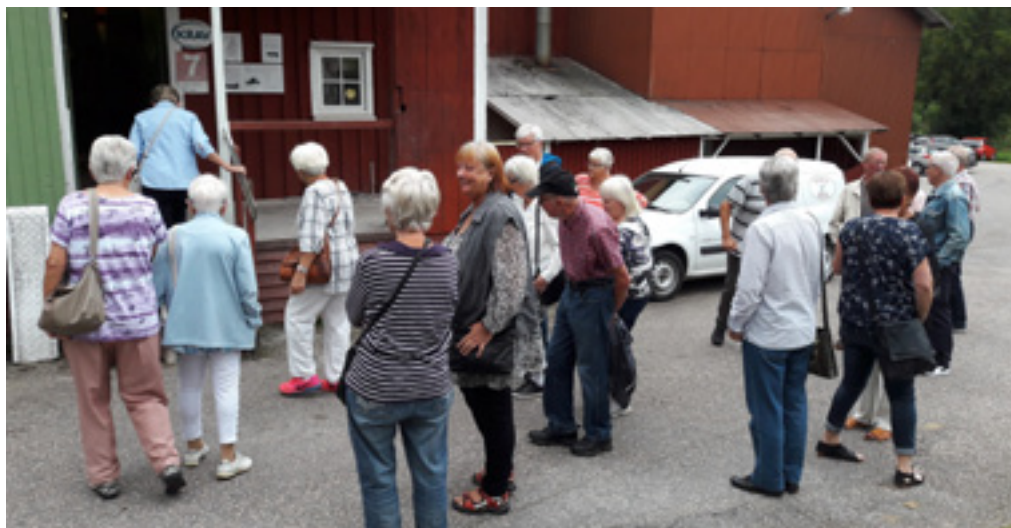
Samling vid kvarnen