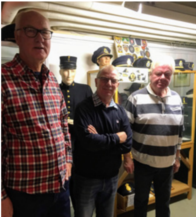
Eldsjälarna på museét