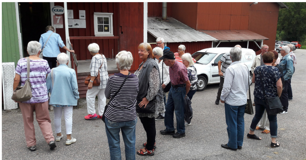
Samling vid kvarnen