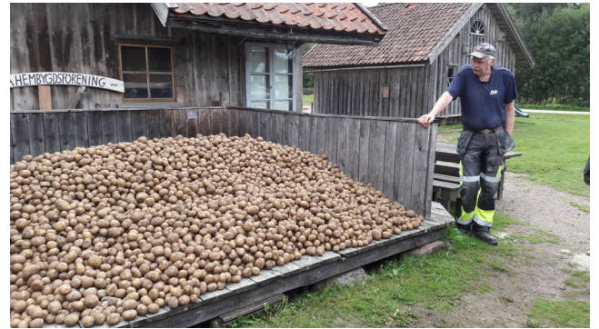
Potatis som ska bli potatismjöl