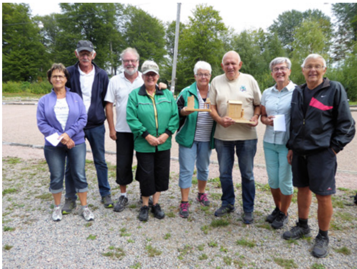
Glada pristagare från Klubbmästerskapet i Boule