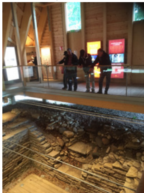
Till vänster:Katas grav.