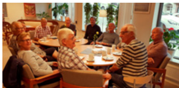
Televeteranerna i Ulricehamns första träff efter sommaruppehållet.