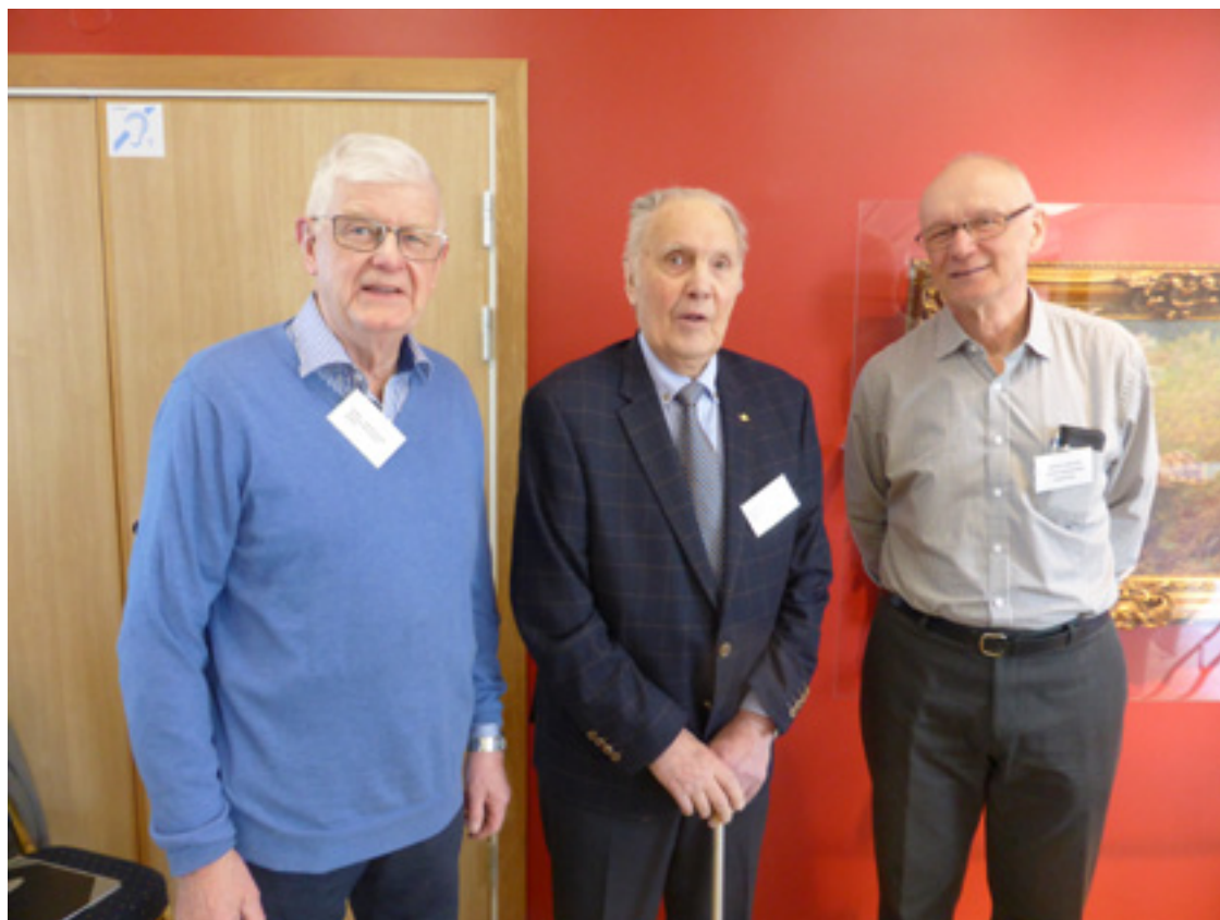
3 ordföranden för televeteranerna