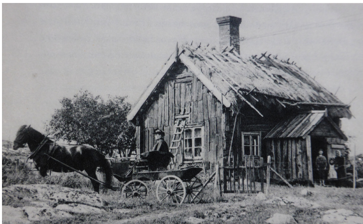
Telefonstation i Västmanland 1902.