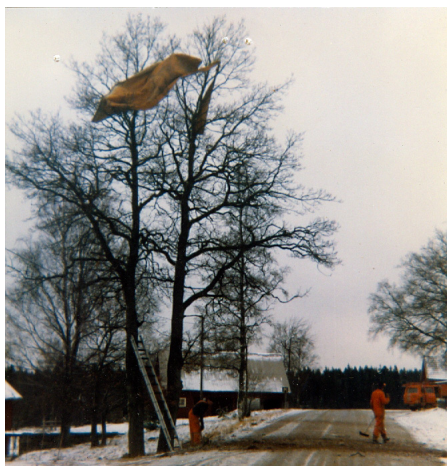
Åke Dalquist har varit i sprängartagen