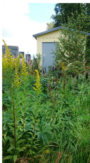
C 500 på Göteborgsvägen i Borås