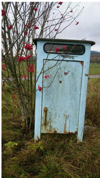
Bortglömd telefonkiosk i Vägerse

Som omväxling till gamla bilder tar vi med några från idag som kan vara intressanta. Kennet Isaksson som nu jobbar på Ericsson har tagit dessa bilder.